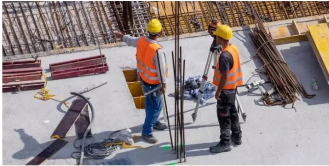
In der Baubranche und Industrie fehlen die Fachkräfte – weil Baby-Boomer in Pension gehen.

Der Schweizer Baubranche fehlt der Nachwuchs. Jetzt müssen Firmen mit mehr Lohn und flexiblen Teilzeit-Pensen um Fachkräfte werben.